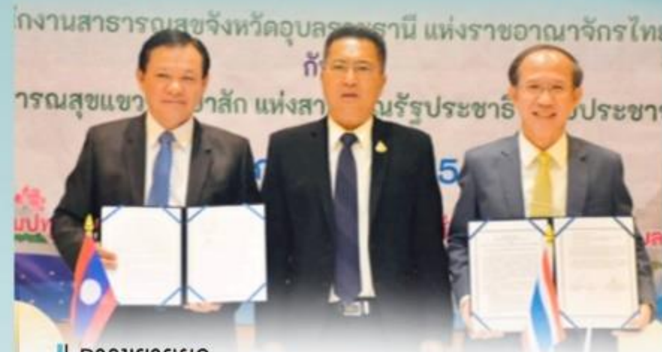
การขยายผล การจัดตั้งศูนย์เรียนรู้ทางการแพทย์สาธารณสุขชายแดน และพื้นที่เฉพาะ