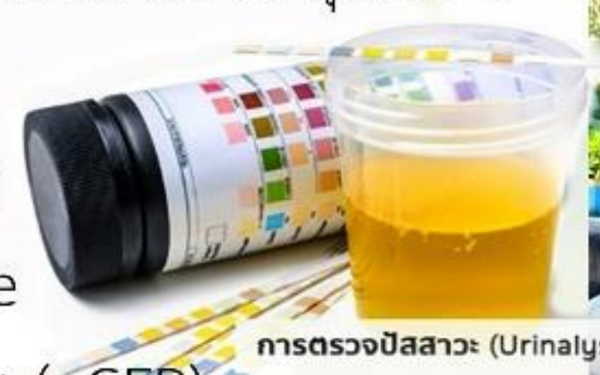
การตรวจปัสสาวะ (Urinalysis : UA)

การคัดกรองภาวะแทรกซ้อนประจำปีในผู้ป่วยเบาหวานเป็นมาตรการสำคัญที่ช่วยลดอัตราการเกิดภาวะแทรกซ้อนรุนแรงและเพิ่มคุณภาพชีวิตของผู้ป่วย CMU ในเขตเทศบาลนครอุบลราชธานี มีบทบาทสำคัญในการให้บริการคัดกรองและดูแลผู้ป่วยเบาหวานอย่างเป็นระบบด้วยความร่วมมือระหว่างเครือข่ายโรงพยาบาลสรรพสิทธิประสงค์ ทำให้เกิดการดูแลสุขภาพที่ครอบคลุมและมีประสิทธิภาพมากขึ้น