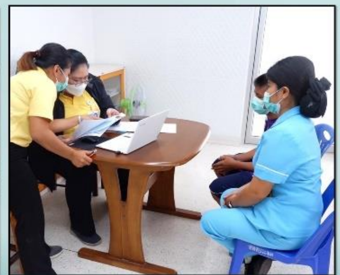
3 คลินิกจิตเวชและยาเสพติด ให้บริการคัดกรอง ตรวจรักษาและให้คำปรึกษาปัญหาทางสุขภาพจิต