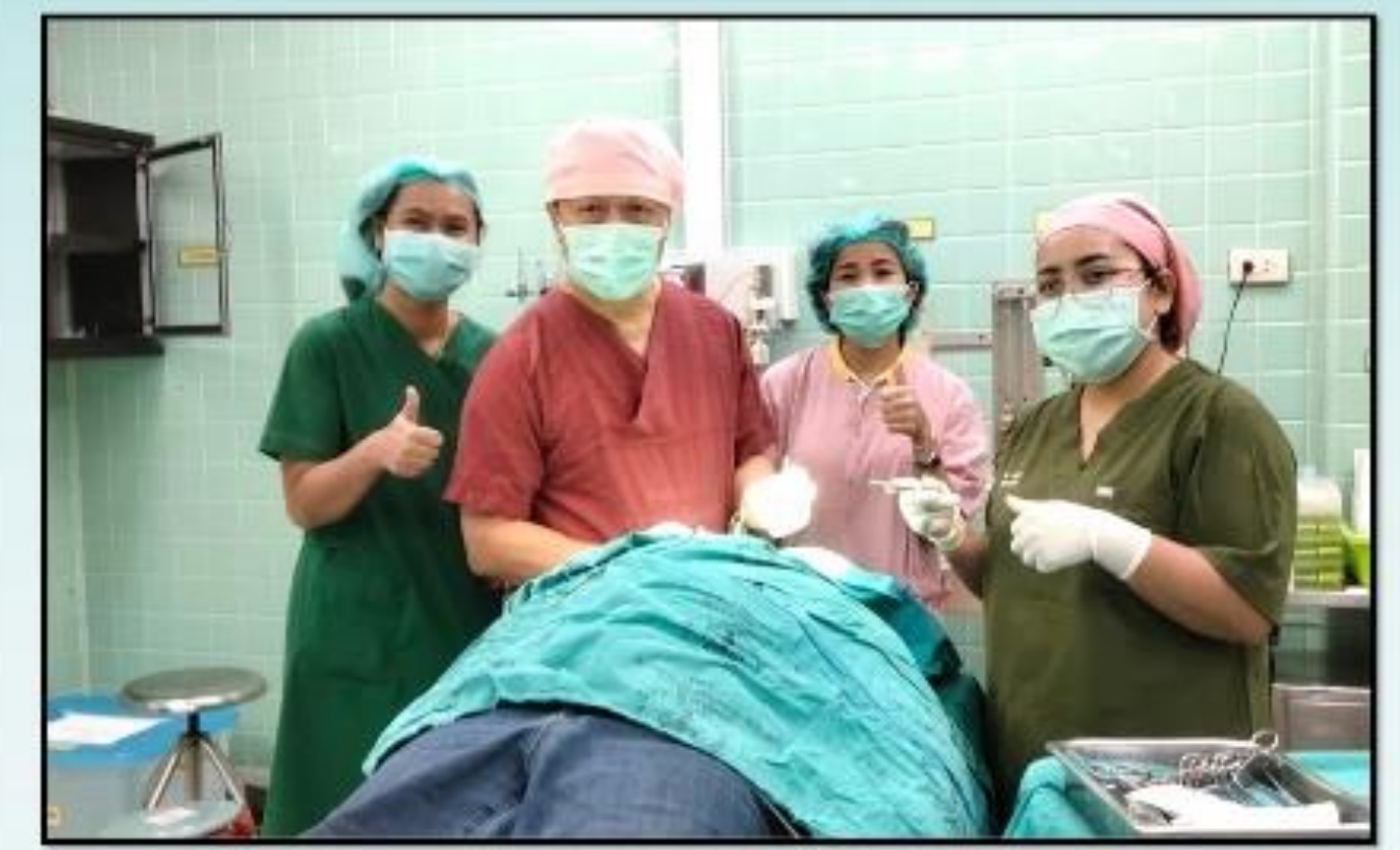
1 คลินิกศัลยกรรม ให้บริการผ่าตัดเล็ก เช่น ก้อน ตึงเนื้อ มะเร็งผิวหนังของร่างกาย