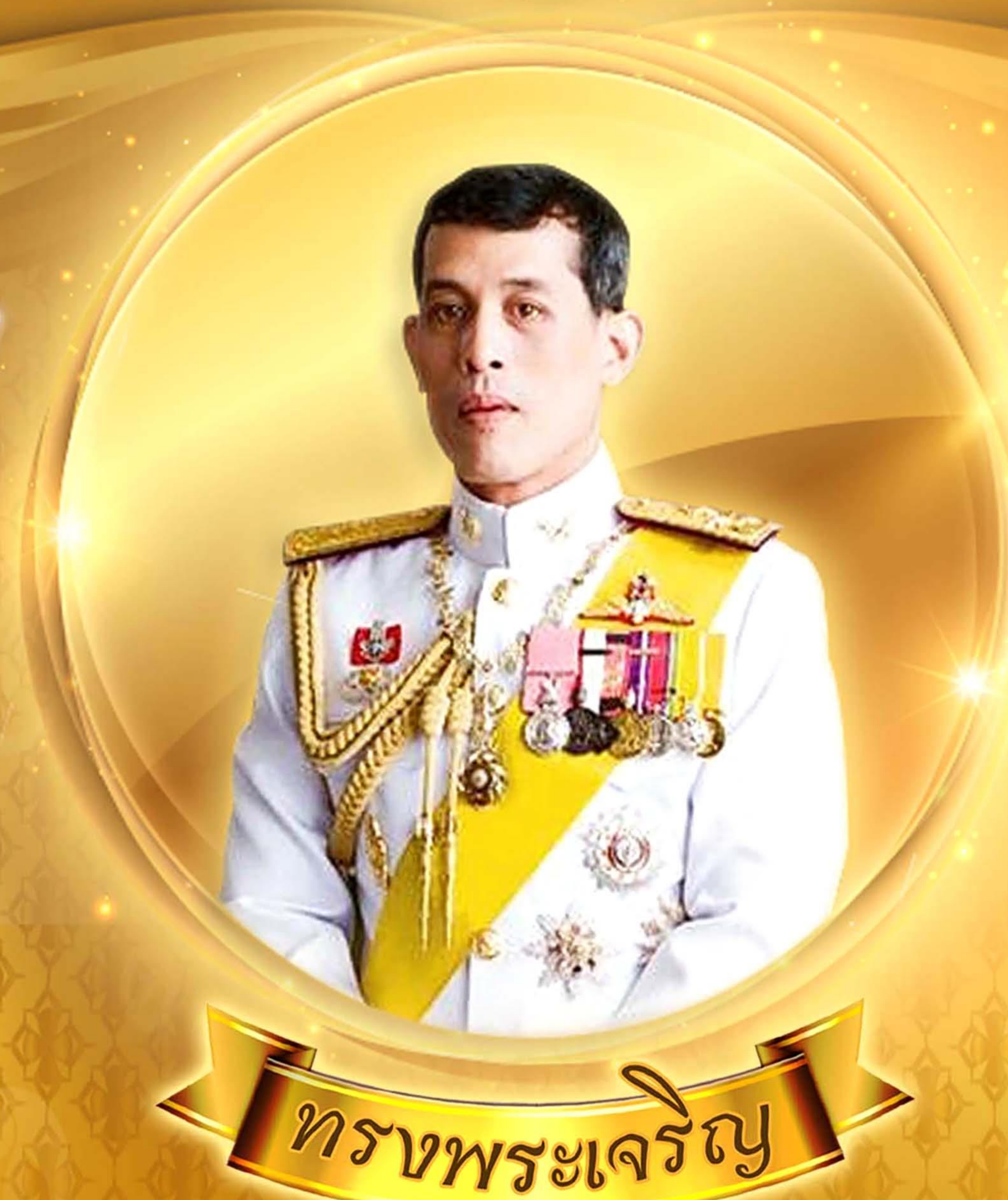
ทรงพระเจริญ

เนื่องในโอกาสวันเฉลิมพระชนมพรรษา พระบาทสมเด็จพระปรเมนทรรามาธิบดีศรีสินทรมหาวชิราลงกรณ พระวชิรเกล้าเจ้าอยู่หัว วันที่ ๒๘ กรกฎาคม ๒๕๖๗