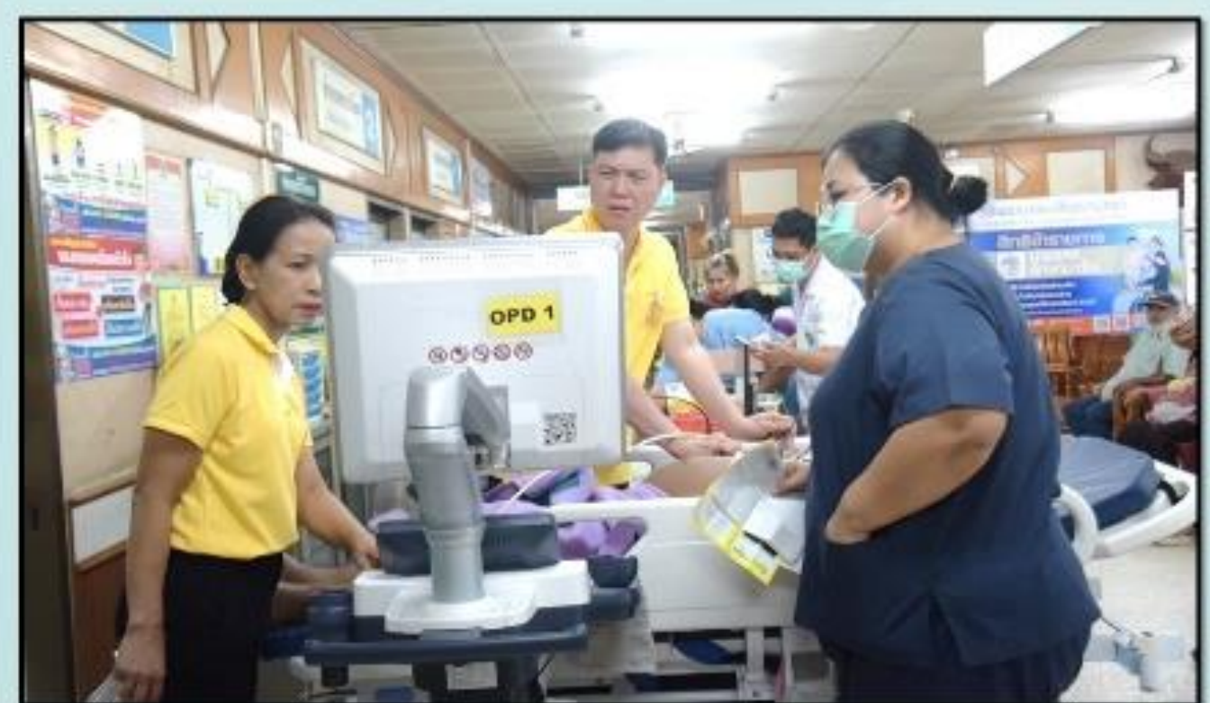
2 คลินิกอายุรกรรมโรคหัวใจ ให้บริการตรวจดูประสิทธิภาพการทำงานของหัวใจด้วยคลื่นเสียงความถี่สูง (Echocardiogram)