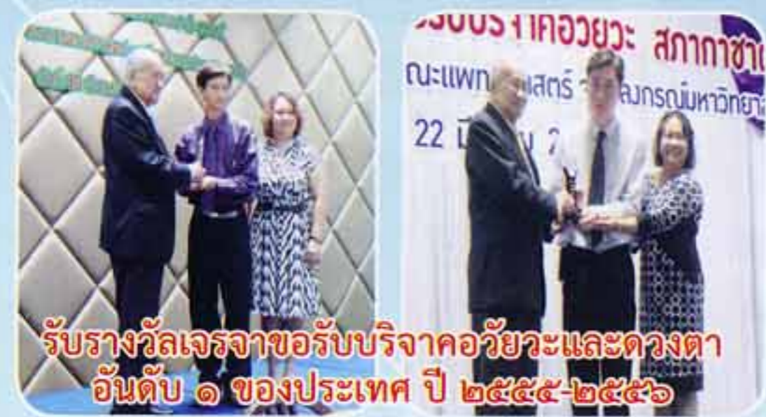
รับรางวัลจรรยาบรรณวิชาชีพและดวงตา อันดับ 1 ของประเทศ ปี ๒๕๕๕-๒๕๕๖