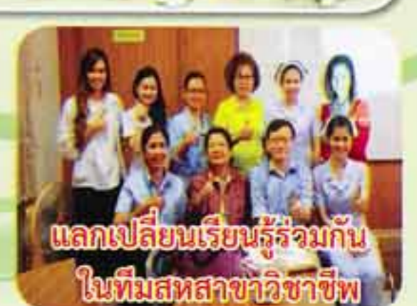
แลกเปลี่ยนเรียนรู้ร่วมกัน ในทีมสหสาขาวิชาชีพ