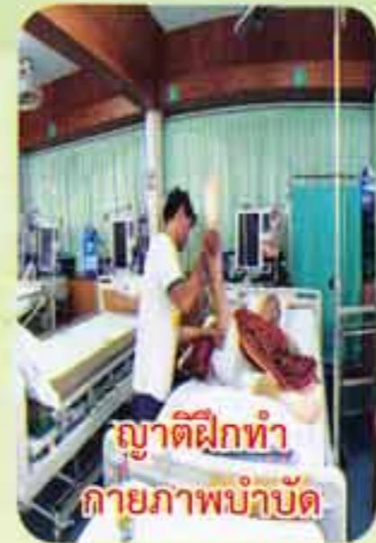
ญาติฝึกทำ กายภาพบำบัด