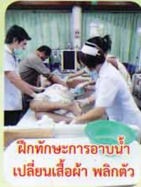
ฝึกทักษะการอาบน้ำ เปลี่ยนเสื้อผ้า พลิกตัว