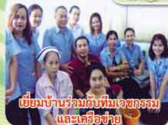
เยี่ยมบ้านร่วมกับทีมเวชกรรม และเครือข่าย