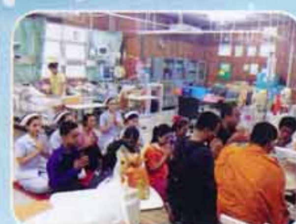
ขอโหลิกรรมผู้บริจาคอวัยวะก่อนไปห้องผ่าตัดและก่อนผ่าตัด