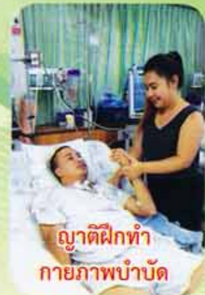
ญาติฝึกทำ กายภาพบำบัด