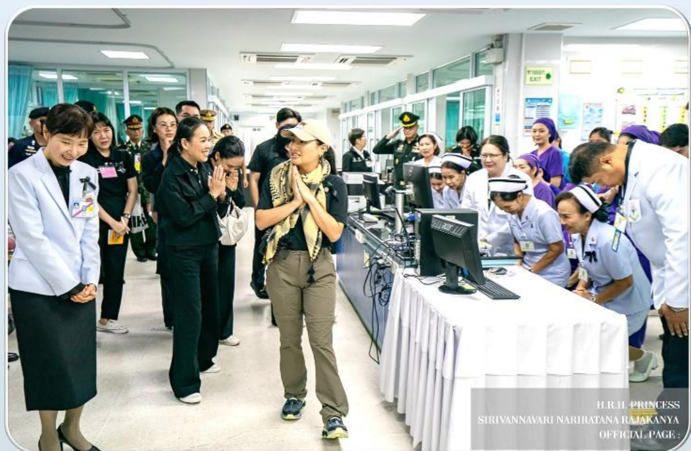
H.R.H. PRINCESS SIRIVANNAVARI NARIRATANA RAJAKANYA OFFICIAL PAGE