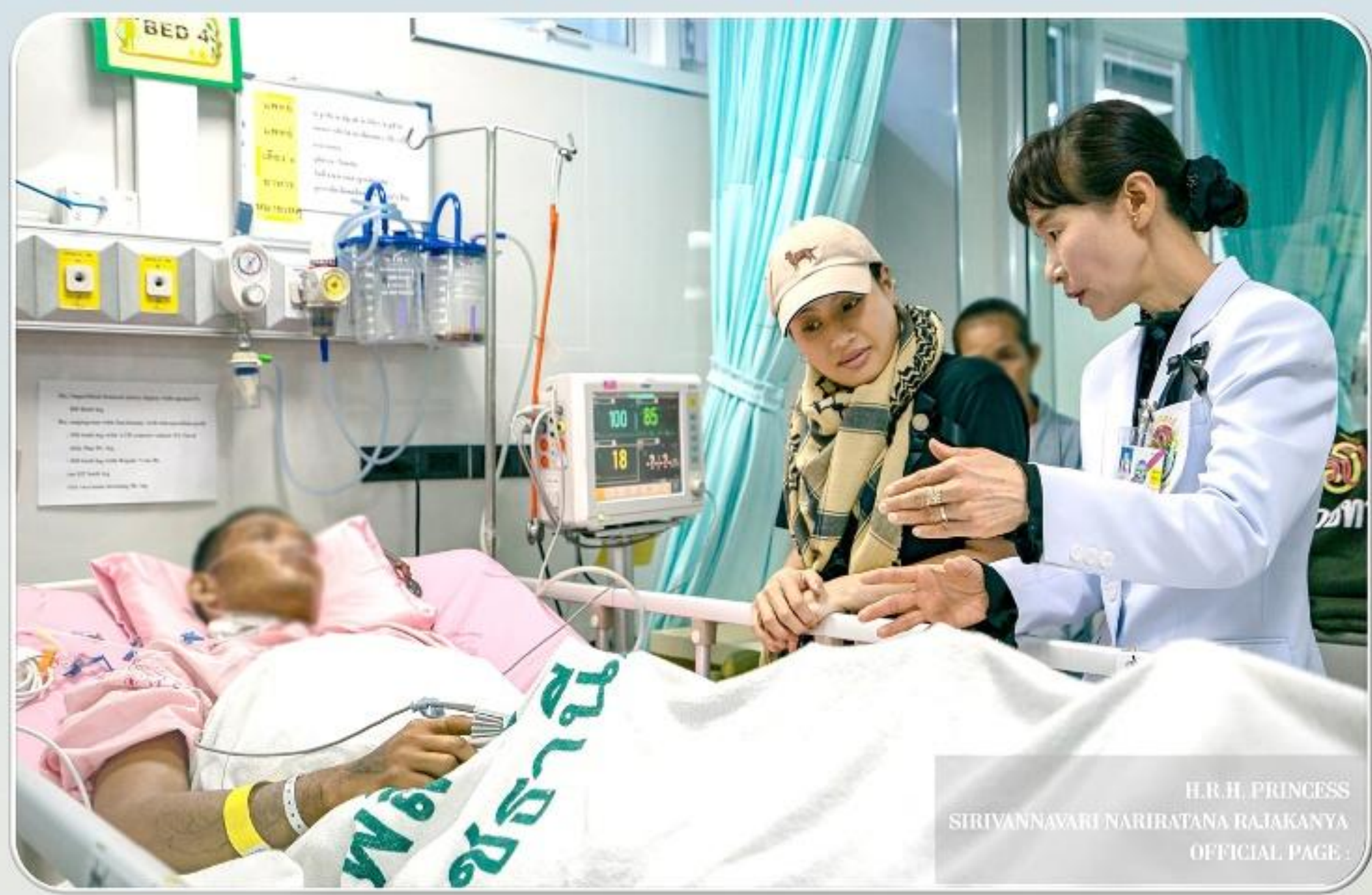
H.R.H. PRINCESS SIRIVANNAVARI NARIRATANA RAJAKANYA OFFICIAL PAGE