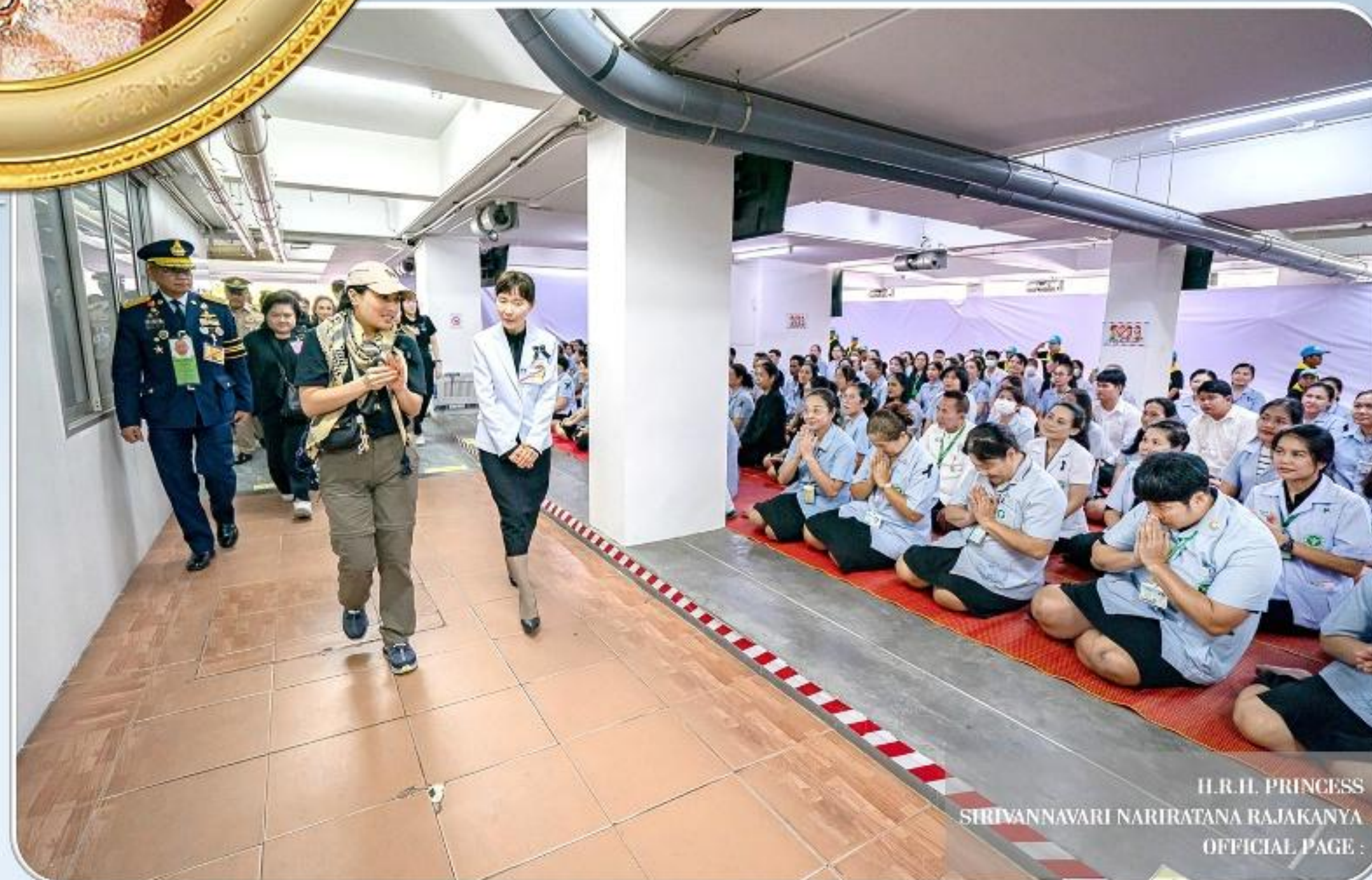
H.R.H. PRINCESS SIRIVANNAVARI NARIRATANA RAJAKANYA OFFICIAL PAGE