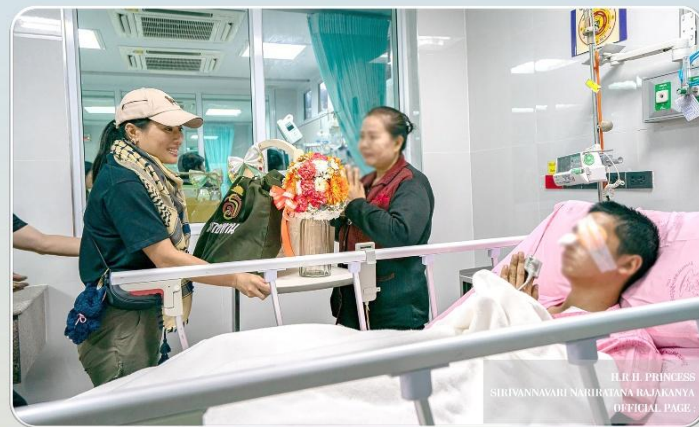
H.R.H. PRINCESS SIRIVANNAVARI NARIRATANA RAJAKANYA OFFICIAL PAGE

สมเด็จพระเจ้าลูกเธอ เจ้าฟ้าสิริวัณณวรี นารีรัตนราชกัญญา ทรงมอบสิ่งของพระราชทานและเยี่ยมทหาร ที่ได้รับบาดเจ็บจากสถานการณ์ชายแดนไทย-กัมพูชา ณ โรงพยาบาลสรรพสิทธิประสงค์ วันที่ 17 ธันวาคม 2568