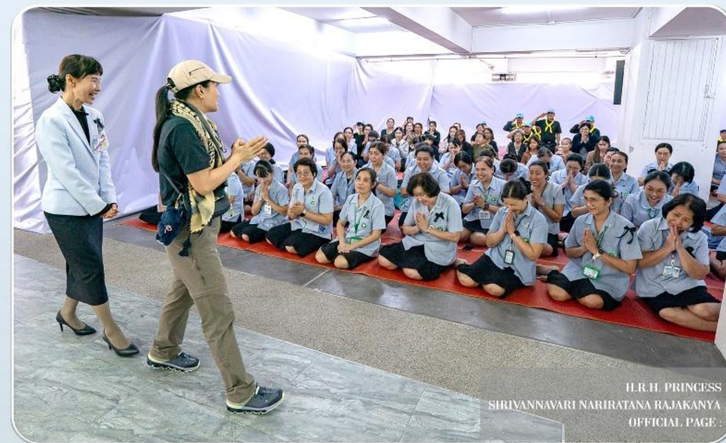
H.R.H. PRINCESS SIRIVANNAVARI NARIRATANA RAJAKANYA OFFICIAL PAGE