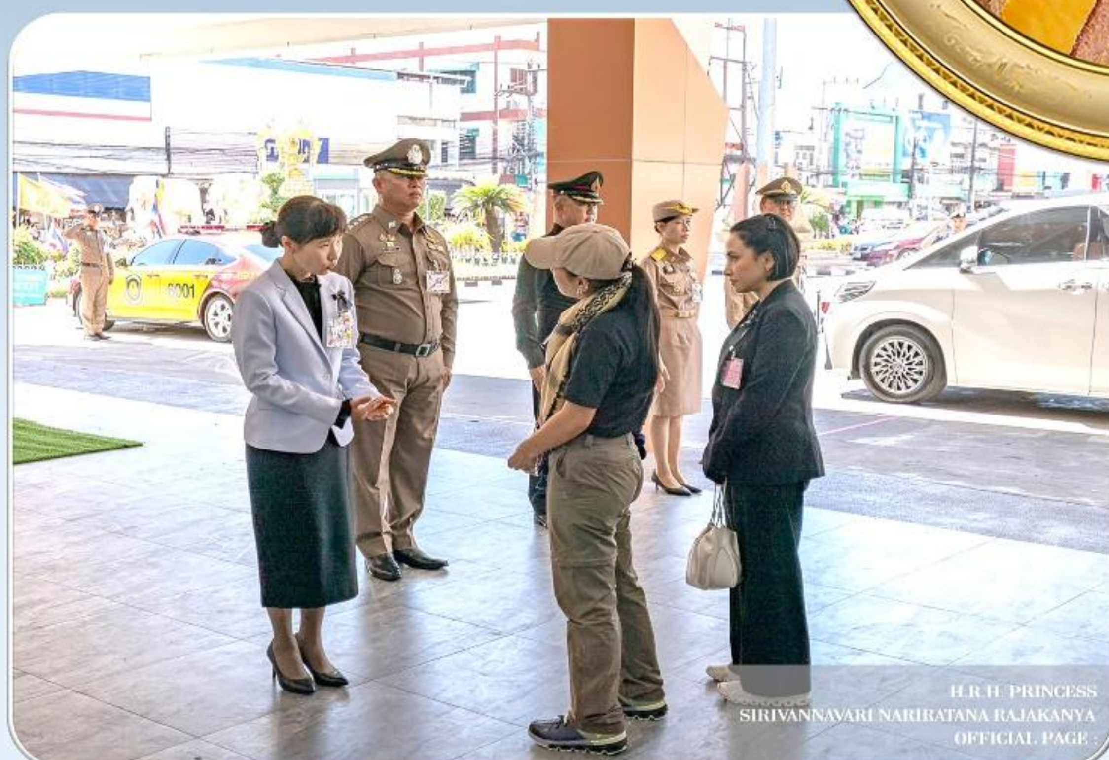
H.R.H. PRINCESS SIRIVANNAVARI NARIRATANA RAJAKANYA OFFICIAL PAGE